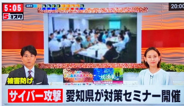
▲8月7日テレビ愛知「5時スタ」にて放映