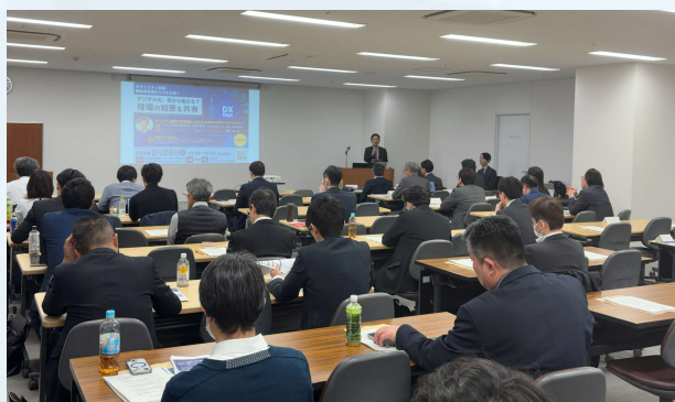
▲成果報告会の様子

生々しい被害の実態に迫る基調講演のほか、診断事業で得られた成果や、中小企業が点検すべき共通のポイントなどを解説。また、実際に検出された脆弱性の事例や具体的な技術的対策を解説しました。