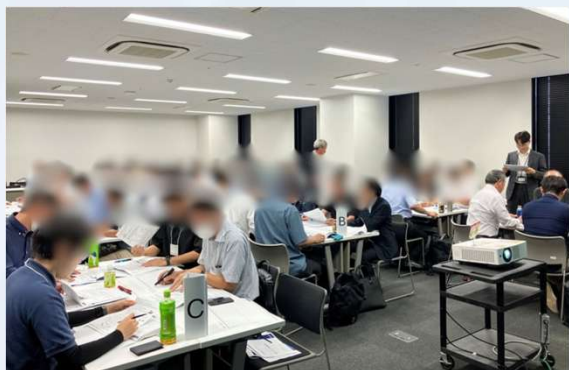
▲名古屋会場ワークショップの様子

名古屋と岡崎の2会場で開催し、延べ80名を超える参加者が受講しました。最新のセキュリティ動向を伝える基調講演に加え、セキュリティ事故が起こった際に必要な対応をワークショップ形式で学ぶ「机上演習」を実施しました。